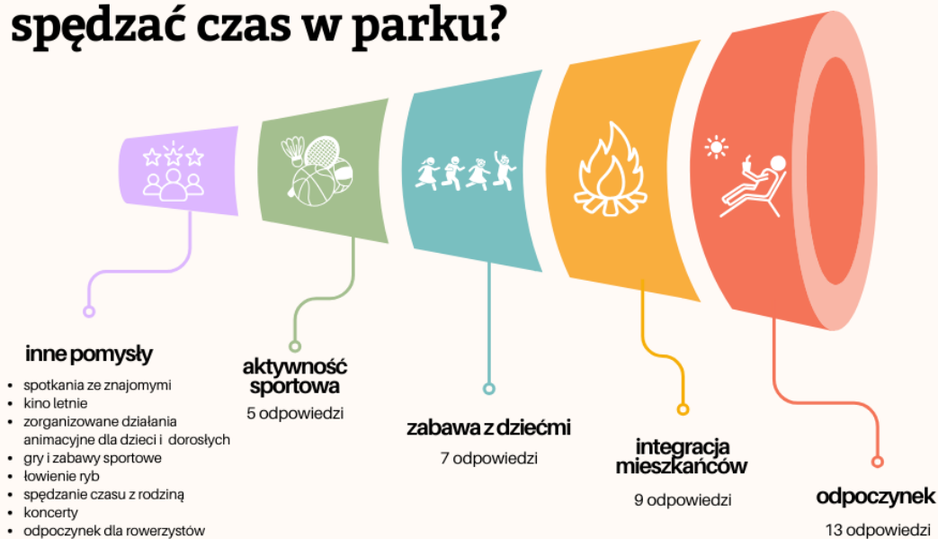
Graf 1. Odpowiedzi z sondażu na pytanie: W jaki sposób chciałabyś / chciałbyś spędzać czas w parku w Dorposzu Szlacheckim?