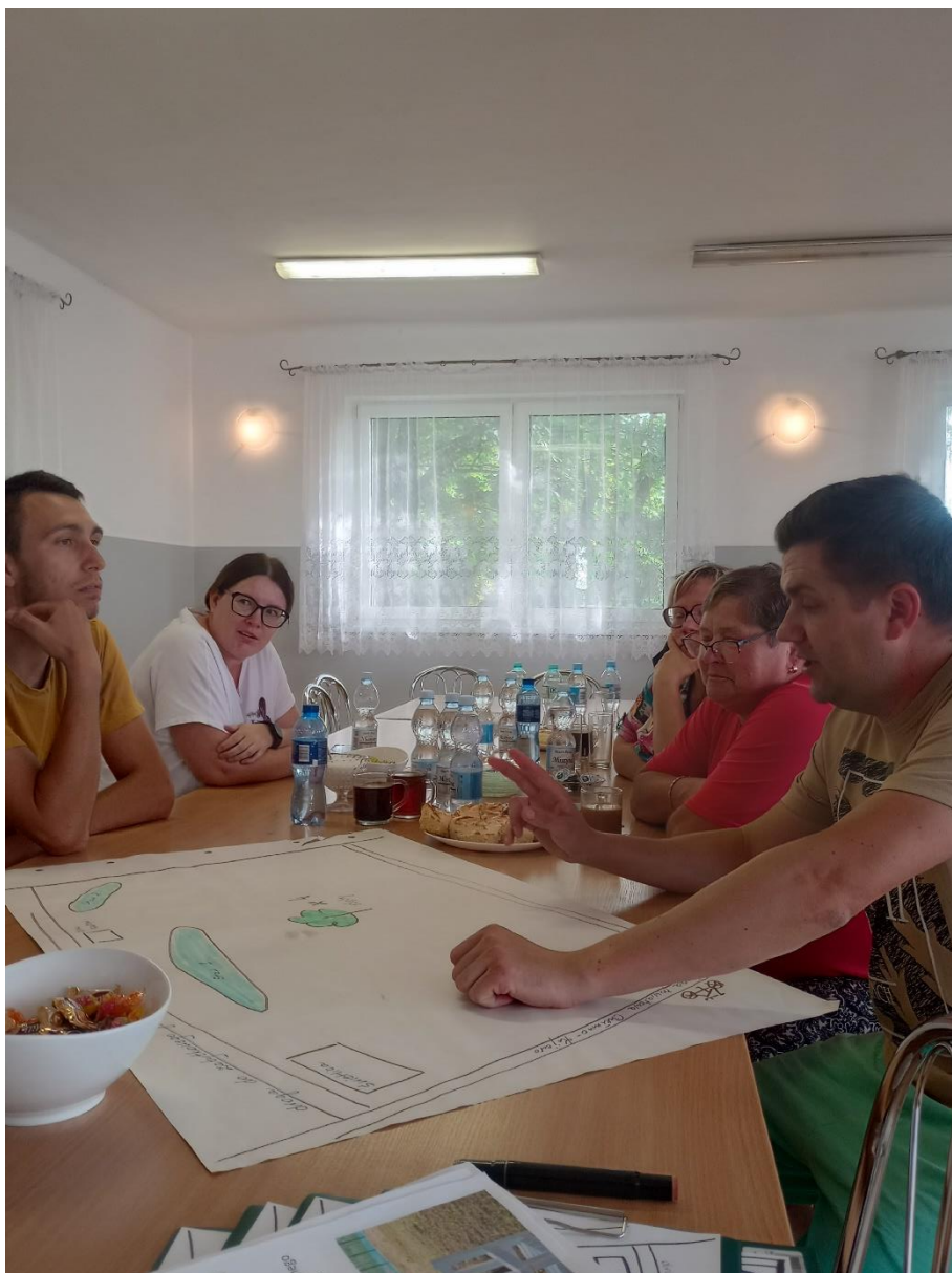
Zdj. 3. Spotkanie warsztatowe z mieszkańcami