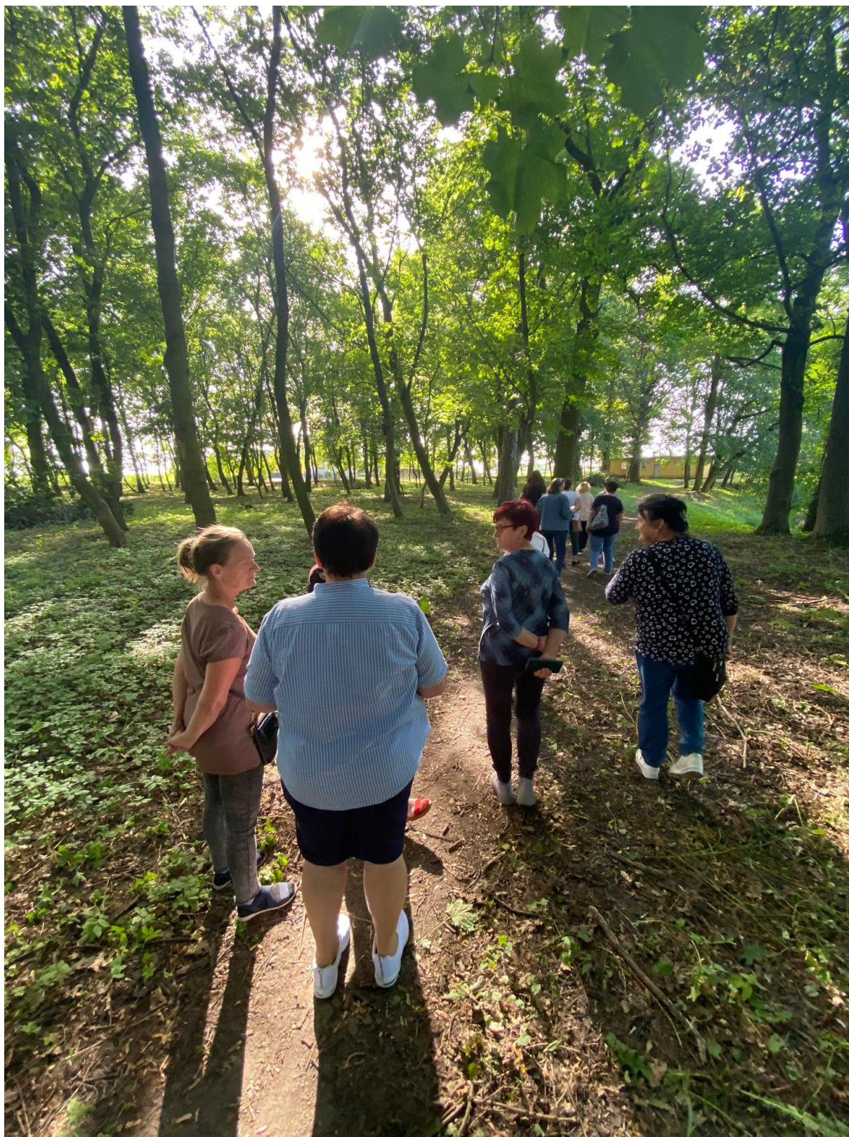
Zdj. 2. Wizja terenowa podczas spotkania warsztatowego