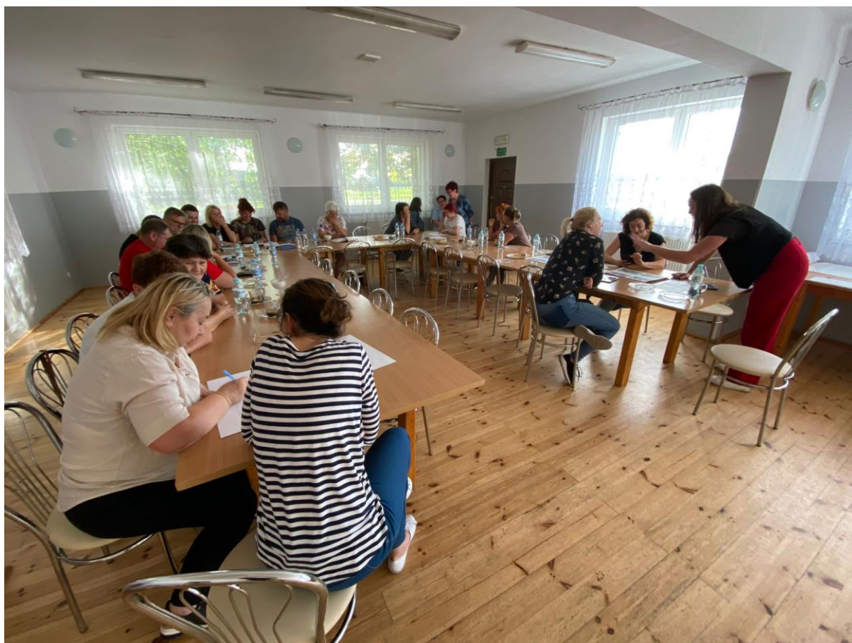
Zdj. 1. Spotkanie warsztatowe z liderami społecznymi

Wśród innych pomysłów na działania w parku, które zebraliśmy podczas spotkań warsztatowcy pojawiły się: plener rzeźbiarski i malarski, warsztaty land art, plenery performatywne, kąpiele leśne, warsztaty zielarskie, potańcówki, festiwale plenerowe, jednorazowy plener dla dedektorzystów, cykliczne spotkania rowerowe, spotkania warsztatowe (np. akademia bezpiecznej jazdy, spotkania z policjantem (ruch drogowy), lekcje przyrodnicze i spacerzy edukacyjne, cykliczne imprezy o różnej tematyce np. konkursy kulinarne, rozgrywki sportowe, festiwale sztuki ludowej, kino „pod chmurką”, koncerty. Wśród pomysłów zgłoszonych przez młodzież pojawiły się dodatkowo: biegi, zawody, imprezki plenerowe, zawody sportowe, gra w piłkę, mecze charytatywne, pikniki rodzinne, różnego rodzaju warsztaty tematyczne.