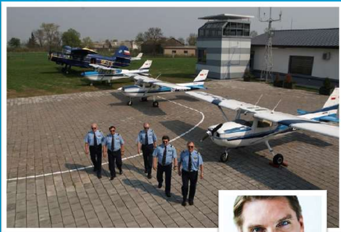
Lotnisko ze szkołą pilotażu w Watorowie