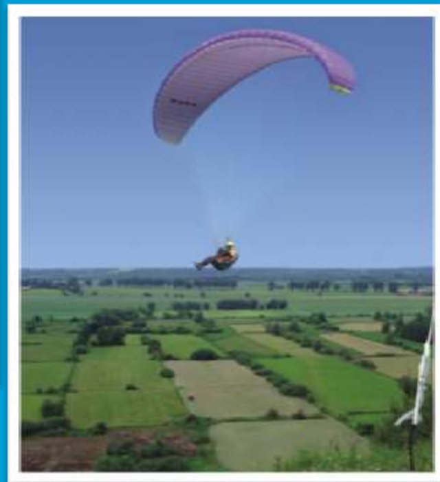
Startowisko paralotni w Kiełpiu