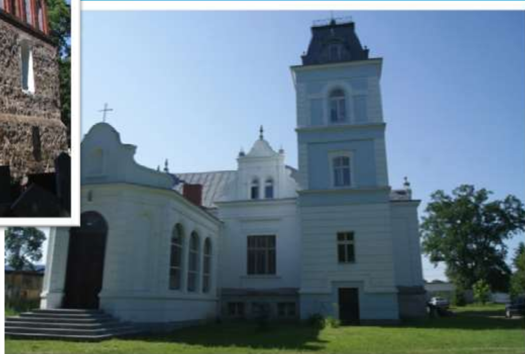
Pałac w Bajerzu