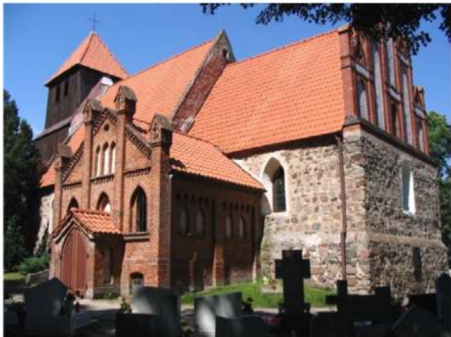
Kościół w Trzebczu Szlacheckim